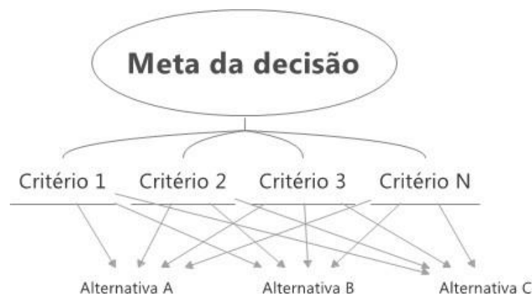
Figura 2 - Estrutura hierárquica genérica do método AHP

Passo 1 : estruturação do problema decisório em níveis hierárquicos, iniciando pela meta da decisão a ser tomada, seguida dos critérios e das alternativas. A figura 2 esquematiza essa estrutura hierárquica.